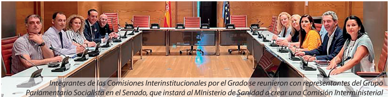
Integrantes de las Comisiones Interinstitucionales por el Grado se reunieron con representantes del Grupo Parlamentario Socialista en el Senado, que instará al Ministerio de Sanidad a crear una Comisión Interministerial