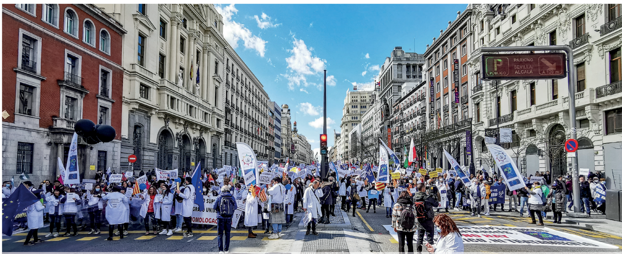
Imagen de la gran manifestación realizada en Madrid en la que participaron más de 8.000 Técnicos Superiores Sanitarios

Previamente los representantes de las Comisiones se concentraron delante del Senado el día 4 de marzo para dar visibilidad, una vez más, a nuestras reclamaciones.