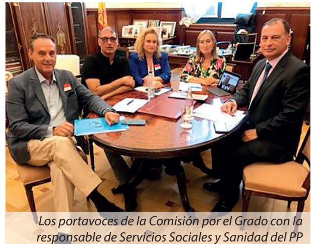
Los portavoces de la Comisión por el Grado con la responsable de Servicios Sociales y Sanidad del PP

Atessa, como organización más representativa de los Técnicos Superiores Sanitarios en Galicia, trabaja por y para la consecución de los objetivos marcados, en busca de que nuestra reclamación se haga visible tanto en nuestro terri-