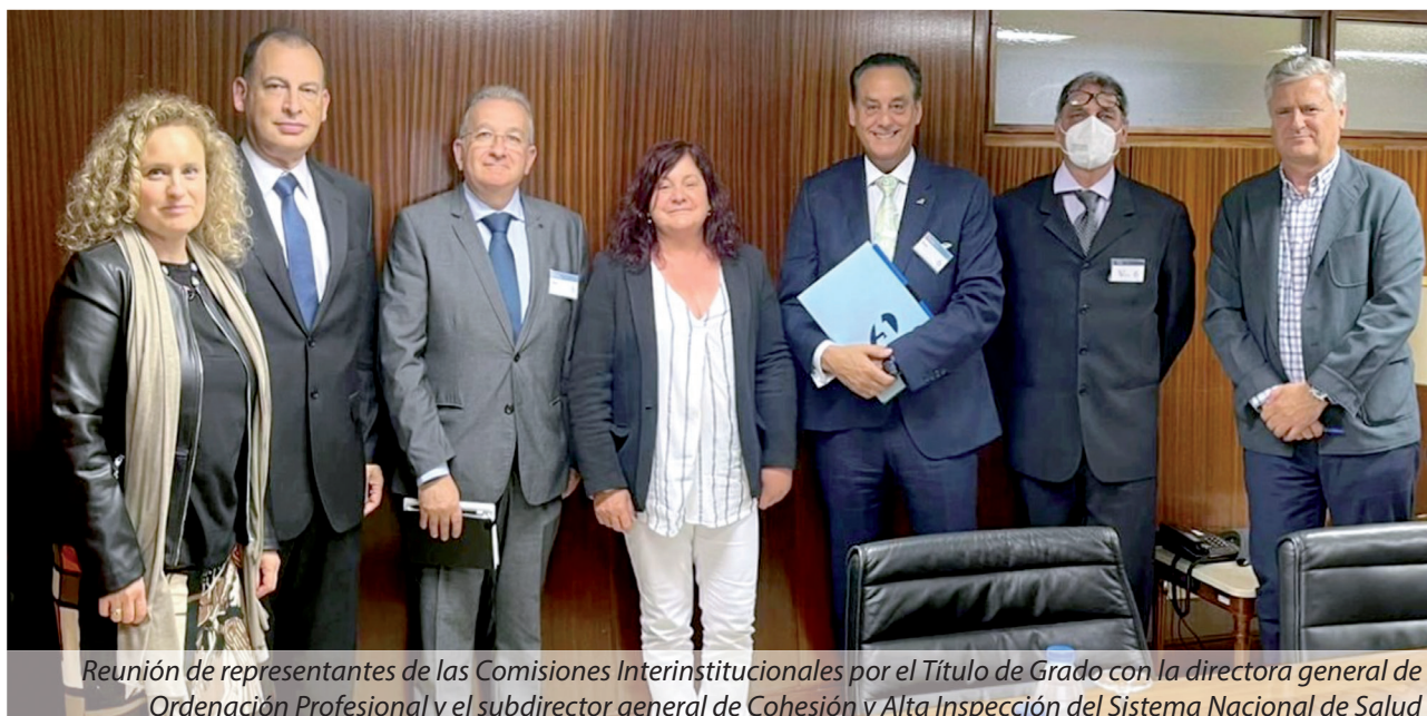
Reunión de representantes de las Comisiones Interinstitucionales por el Título de Grado con la directora general de Ordenación Profesional y el subdirector general de Cohesión y Alta Inspección del Sistema Nacional de Salud

El sentir de toda la profesión es que estamos hartos, que nos están abocando a un enfrentamiento social de consecuencias impredecibles, estamos cansados de tanta manipulación e intereses corporativos y que la Administración solo tenga oídos y soluciones para otros. Este posicionamiento es un daño profesional de dimensiones incalculables e irreparables, para el conjunto de la Profesión, del Sistema Nacional de Salud, y de la Ciudadanía. Nos están pidiendo a gritos que nos movilizemos en contra de esta injusticia.